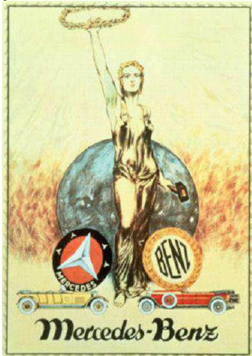
Abb. 60 (x175/236): Daimler Benz: Wahlplakat des 1926 neu entstandenen Berliner Automobilkonzerns.

Die deutsche Wirtschaft erkämpfte sich mit harter, unermüdlicher Arbeit und großem Fleiß viele verlorene deutsche Absatzmärkte zurück. Aufgrund ihrer hervorragenden Qualität eroberte besonders die deutsche Exportindustrie (Maschinen, Werkzeuge, Elektrogeräte und Chemierzeugnisse) schon bald wieder alle Erdteile.