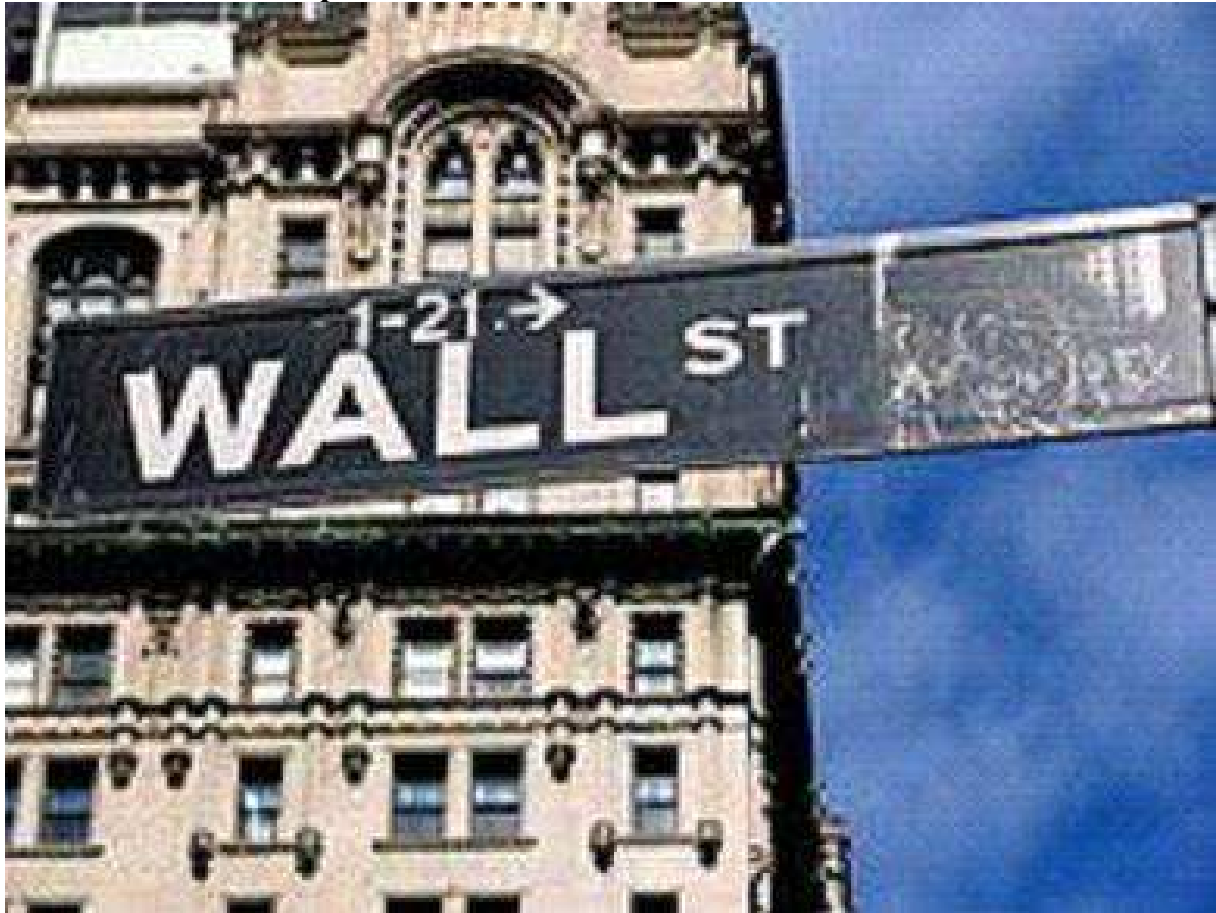
Abb. 61 (x905/...): Wall Street, Straße in New York City.

Agenten des preußischen Innenministers Severing berichteten, daß Hitlers Wahlkämpfe seit 1929 hauptsächlich durch ausländische Banken (z.B. durch das New Yorker Bankhaus Kuhn, Loeb & Co.) und nordamerikanische Großindustrielle (Royal Dutch, Standard Oil, Rockefeller jun. und andere) finanziert wurden.