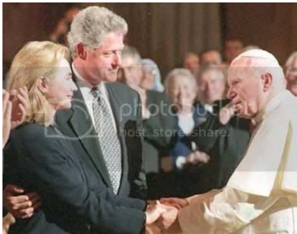
Bill und Hillary Clinton bei Papst Johannes Paul II.