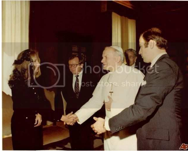
Jill und Joe Biden bei Papst Johannes Paul II.