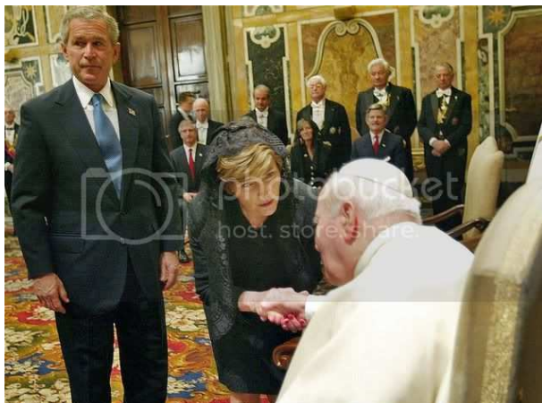
George W. und Laura Bush bei Papst Johannes Paul II.