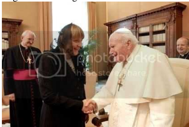
Angela Merkel bei Papst Johannes Paul II.

Weil dermaßen viele Millionen von Menschen diesen Schmutz und diese Degeneriertheit der Welt, in der wir leben, geradezu lieben. Sie lieben es. Sie lieben den Heiligen Vater und all ihre Pracht und Herrlichkeit, der Politiker und Könige und Herrscher und die Bilder von Bush, wie er den Ring des Heiligen Vaters küßt. Nach was sieht das aus, wie Nancy Pelosi, Sprecherin des Repräsentantenhauses, ganz in Farbe in den Nachrichten, sich verbeugt und Ehrerbietung zeigt und sich verbeugt und den Ring des römischen Pontifex küßt?