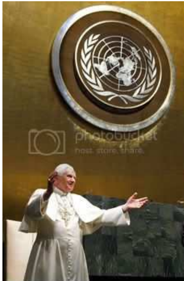
Papst Benedikt XVI. spricht zur UNO-Generalversammlung

Die Männer, die unsere großartige Nation gegründet haben, würden sich übergeben. Angesichts dieses Verrats, höchsten Verbrechens und Verrats gegen den Staat. Aber diese Leute, die sich selbst Anführer Amerikas nennen. Ich sage Ihnen: der Vatikan hat uns die Mafia gegeben, Drogenhandel, Prostitution, Terrorismus, Gewalt, Kinderpornographie, all das.