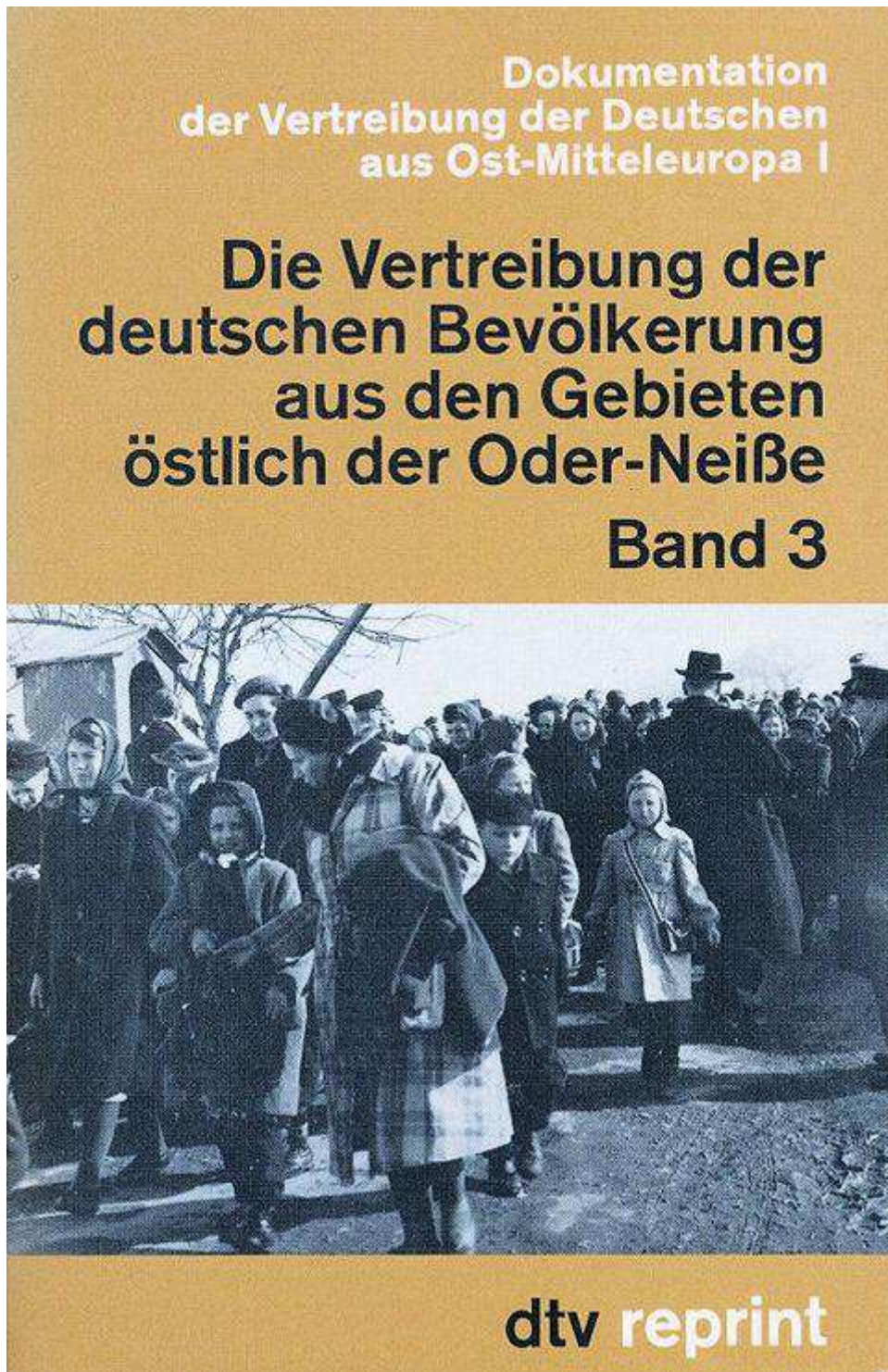
Abb. 73 (x003/Titelblatt): Die Vertreibung der deutschen Bevölkerung ...

Die Massenvertreibung der Ost- und Volksdeutschen verstieß zweifelsfrei gegen das damalige Völkerrecht (u.a. "Verbrechen gegen die Menschlichkeit"). Die Abmachungen über die vorläufige Oder-Neiße-Linie waren besonders verwerflich und unmenschlich, weil sie bei den Ost- und Volksdeutschen jahrelang die unrealistische Hoffnung förderte, daß man später in die Heimat zurückkehren könnte.