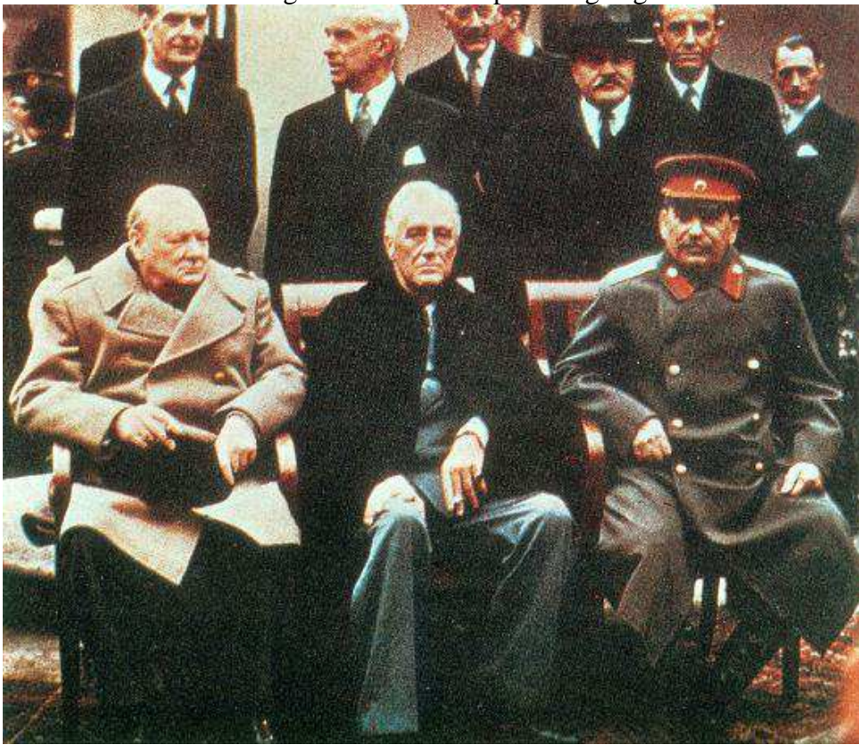
Abb. 68 (x092/924): Die Verhandlungspartner von Jalta (sitzend von links Churchill, Roosevelt, Stalin).

Der sterbenskranke Präsident stand offensichtlich unter starken Drogen und Schmerzmitteln, denn er reagierte im Verlauf der Konferenz phasenweise völlig apathisch oder überaus euphorisch. Roosevelts persönlicher Berater Harry Hopkins (1890-1946, ein überzeugter Stalin-Anhänger) war ebenfalls todkrank. Hopkins litt seit 6 Jahren an einer unheilbaren Krebserkrankung und wurde auf einer Tragbahre zu den Besprechungen gebracht.