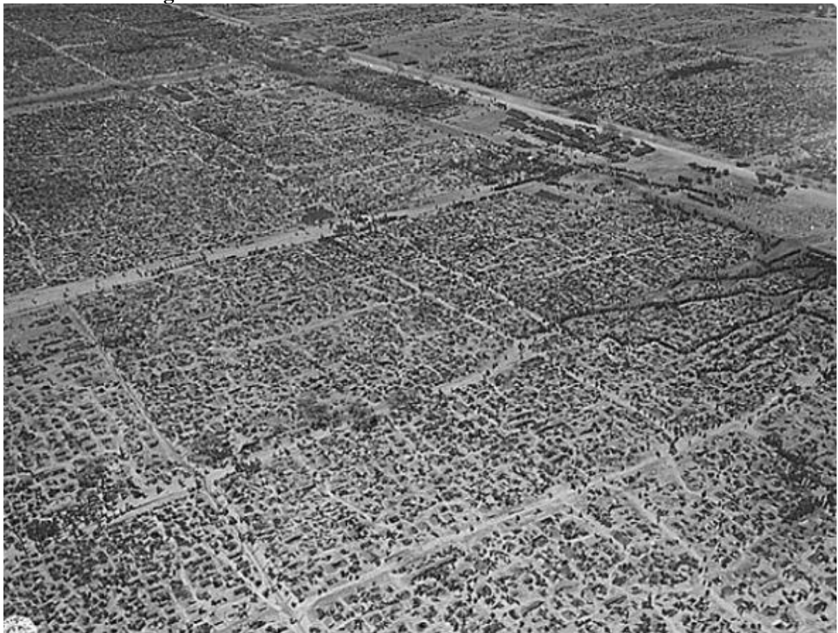
Abb. 69 (x131/192a): Eines der sogenannten Rheinwiesenslager bei Sinzig am Rhein, Frühjahr 1945.

"Der geplante Tod" der deutschen Kriegsgefangenen in den nordamerikanischen und französischen Lagern im Jahre 1945