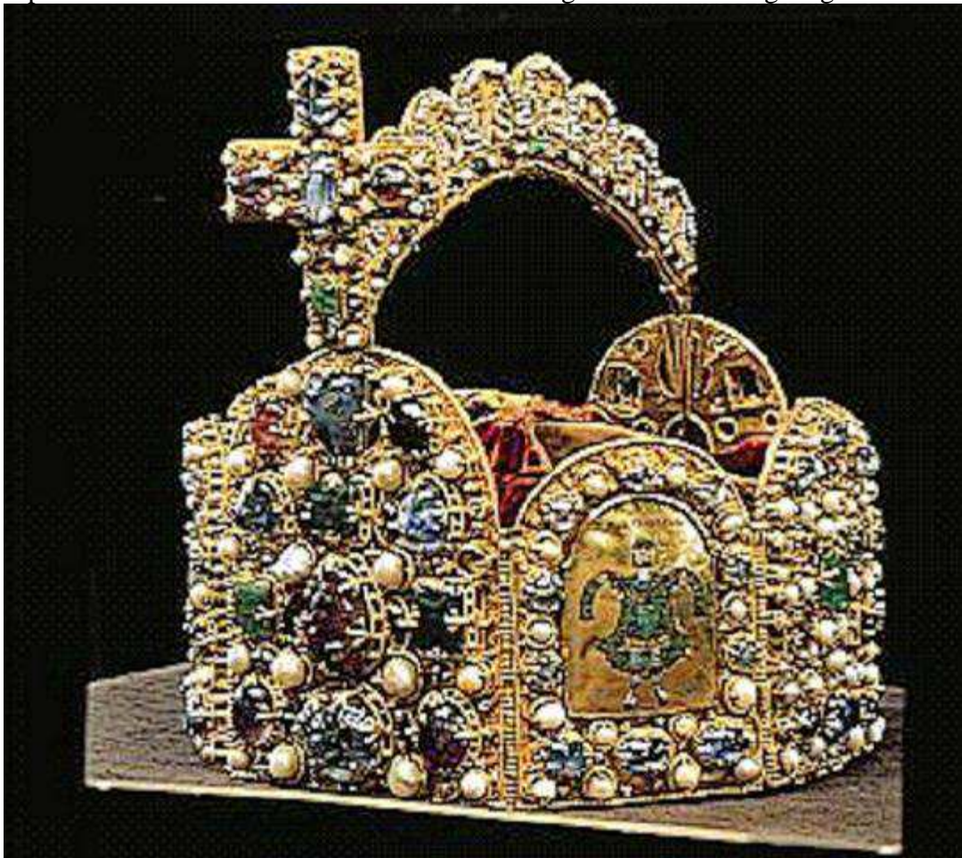
Abb. 15 (x315/29): Reichskrone des deutschen Kaisers (ab 962).

Awaren, Sarazenen, Dänen, Slawen mit Waffengewalt besiegt, Italien unterworfen, die Götzentempel bei den benachbarten Völkern zerstört und geistliche Ordnung eingerichtet habe.<<