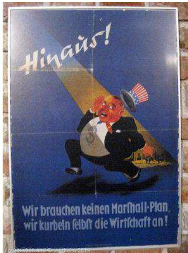
Abb. 75 (x149/116): Welche Zielsetzungen des Marshallplanes bringt dieses Werbeplakat zum Ausdruck?