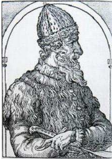
Abb. 20 (x255/110): Iwan III. der Große (1462-1505).

Rußland: Der Moskauer Großfürst Iwan III. stellt die Tributzahlungen an die Mongolen ein, vertreibt im Jahre 1480 die "Goldene Horde" und befreit Rußland nach 235 Jahren von der mongolischen Gewaltherrschaft.