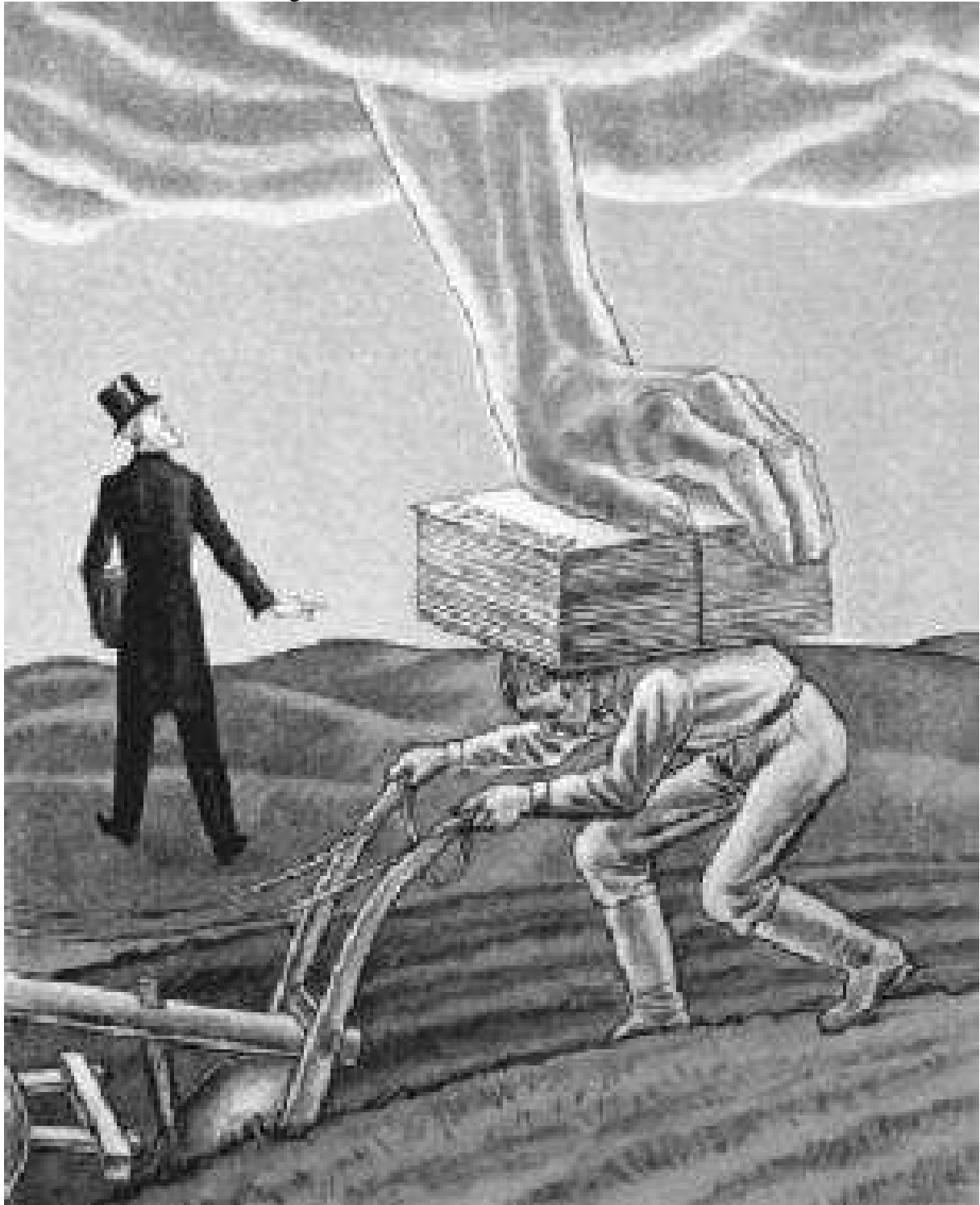
Abb. 57 (x065/371): "Statt der 14 Punkte 440 unerfüllbare Paragraphen". Karikatur von E. Schilling auf den Versailler Vertrag.

Die meisten Deutschen, die den Versprechungen der Siegermächte bedingungslos geglaubt hatten, wurden bitter enttäuscht. Nach der Entwaffnung des deutschen Heeres begann für die Deutschen eine endlose Tragödie. Fast niemand war bereit, den Deutschen zu helfen.