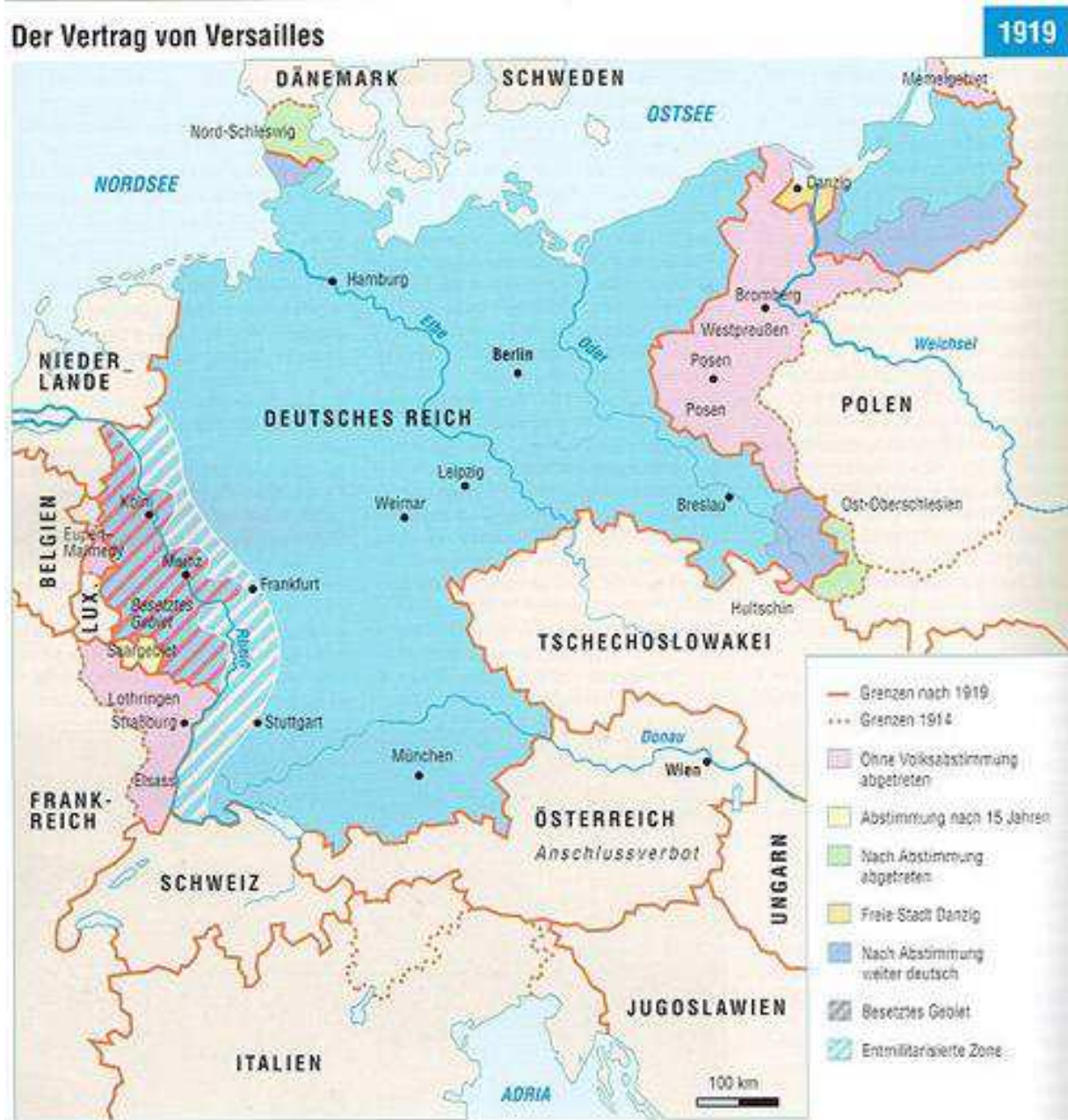
Abb. 56 (x315/118): Grenzen des Deutschen Reiches nach 1919.

Der größte Teil Westpreußens (das Kulmerland und Pommerellen, ohne die Freie Stadt Danzig) fiel 1919/20 an Polen, so daß Ostpreußen wieder vom Deutschen Reich getrennt wurde. Der polnische Korridor (größtenteils mit Pommerellen bzw. Westpreußen identisch) entsprach fast den Abtretungsgebieten des Jahres 1466.