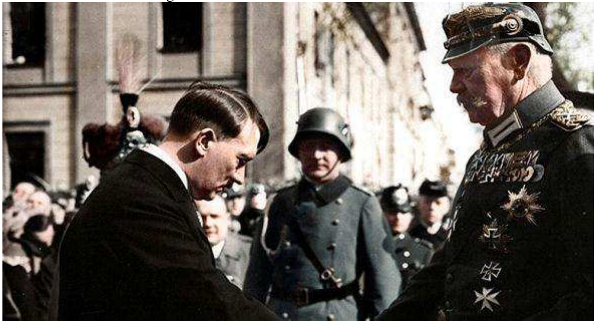
Abb. 65 (x296/129): Hitler begrüßt Hindenburg am 21.03.1933 bei einem Staatsakt in Potsdam.

Am 21. März 1933 eröffnete das NS-Regime mit einem Staatsakt in der Potsdamer Garnisonkirche den ersten Reichstag des "Dritten Reiches".