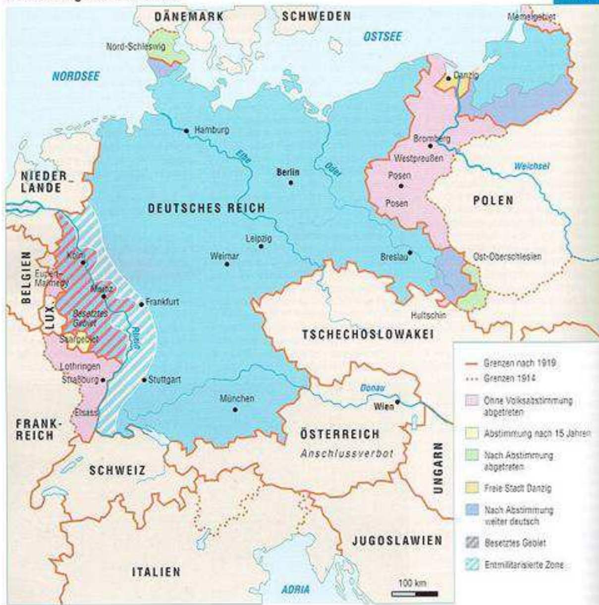
Abb. 56 (x315/118): Grenzen des Deutschen Reiches nach 1919.

Bei den Gebietsabtretungen spielte Frankreich eine besonders unrühmliche Führungsrolle und befürwortete speziell den polnischen und tschechischen Expansionsdrang nach Westen. Die Polen und Tschechen sollten nach den französischen Wunschvorstellungen die bisherige Aufgabe der Deutschen als sogenannte "Pufferzone" zwischen Ost- und Westeuropa übernehmen und wichtige Eckpfeiler gegen Rußland werden. Diese kurzsichtige und menschenverachtende Politik änderte nicht nur die Landkarten Ost-Mitteleuropas grundlegend, sondern sie bedeutete letztlich auch den ersten Schritt zur Liquidation der jahrhundertealten deutschen Ostsiedlung. Nach dem Versailler Vertrag mußte das Deutsche Reich zwangsweise auf folgende Gebiete verzichten: