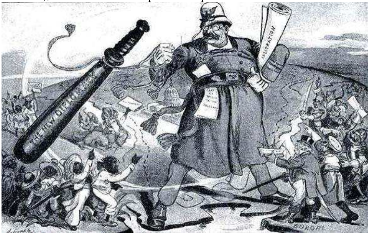
Abb. 48 (x239/189): "Der Schutzmann der Welt" - amerikanische Karikatur auf Theodore Roosevelts "Politik des großen Knüppels", 1905.

McKinleys Nachfolger, Vize-Präsident Theodore Roosevelt (1858-1919, US-Präsident von 1901-1909), setzte die US-Weltmachtpolitik konsequent fort.